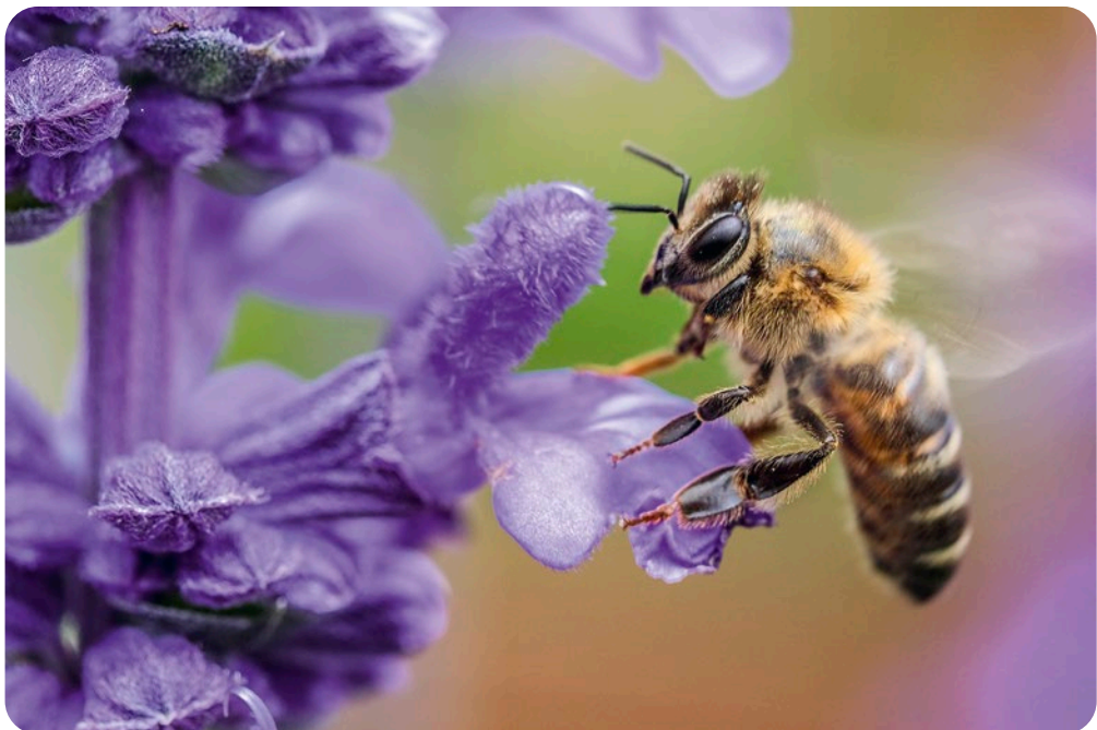
Mehiläinen on tehokas pölyttäjä ja merkittävässä asemassa maailman ravinnontuotannon kannalta. Eri mehiläislajit pölyttävät arviolta 75–85 % maailman kasveista.

Oleellista on se, kuinka suunnittelemme yhteiskunnan järjestelmiä ja kannattelemme yhteisöjä, jotta ne järjestäytyvät tuottamaan aina uutta elämää ja elinkykyä synnyttäviä olosuhteita.