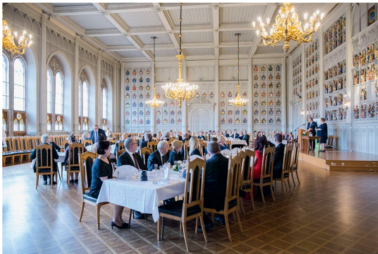
Tietojohtaminen ry:n 75-vuotisjuhлагаalaan Ritarihuoneen juhlasalissa osallistuu runsas vierasjoukko.