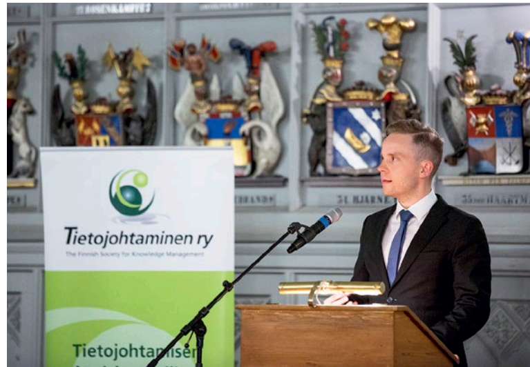
Tiede- ja kulttuuriministeri Petri Honkonen tuo juhlaan valtiovallan tervehdyksen.