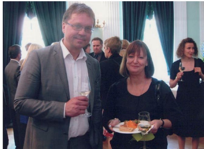
Apulaiskaupunginjohtaja Pekka Sauri isännöi kaupungin vastaanottoa.