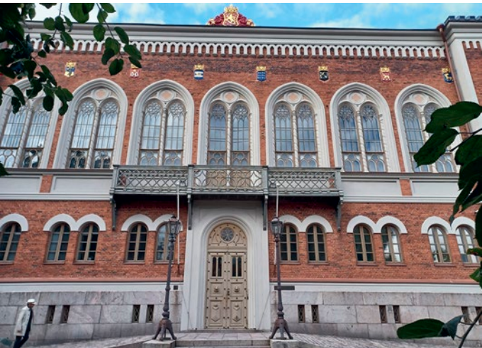
Yhdistyksen toimisto muuttaa vuonna 2010 Ritarihuoneen tiloihin Helsinkiin.

Tietojohtaminen on Suomessa vielä alkutekijöissään, vaikka sen tärkeys on toki tiedossa. Yritysmailmassa tiedon hallinnasta ja jalostamisesta on kehittyneessä kilpailutekijä, joka luo mahdollisuuksia menestyä globaaleilla markkinoilla tai ainakin kilpailla tasavertaisesti raadallisilla markkinoilla. "Tieto tarvitsee johtajan" on slogan, joka onnistuneesti korostaa tietopalvelun ammattilaisten merkitystä organisaatioissa, sillä tiedon ammattilaiset pystyvät luomaan lisäarvoa. "Tieto aineettomana pääomana on muodostunut merkittäväksi yritysten kilpailuedun kanalta", kiteyttää ulkoministeriön tiedottaja Riikka Harju asiaa Tietopäivillä 2011.