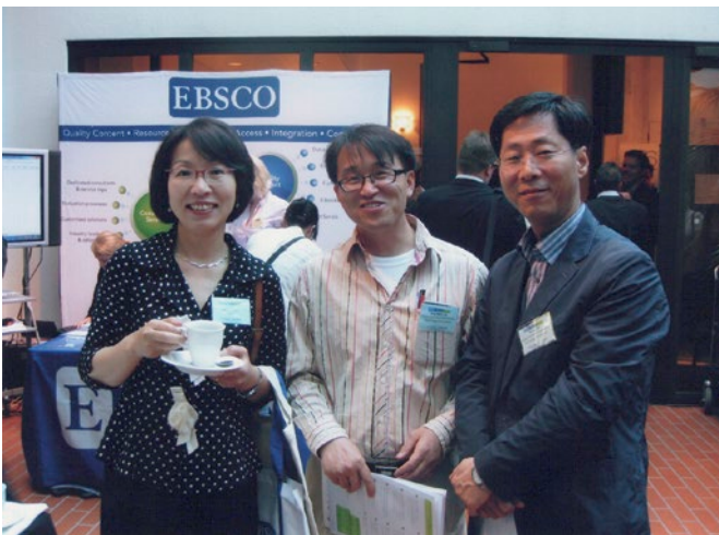
ICSTI-tapahtumassa on runsaasti osallistujia Etelä-Koreasta.