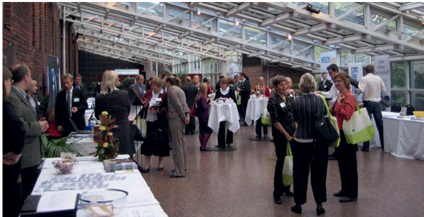
Näyttelystä materiaalit kootaan Tietoasiantuntija-kassiin.