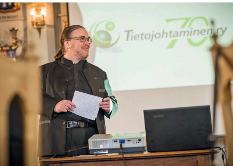
Kansanedustaja Jyrki Kasvi pitää juhlapuheen.