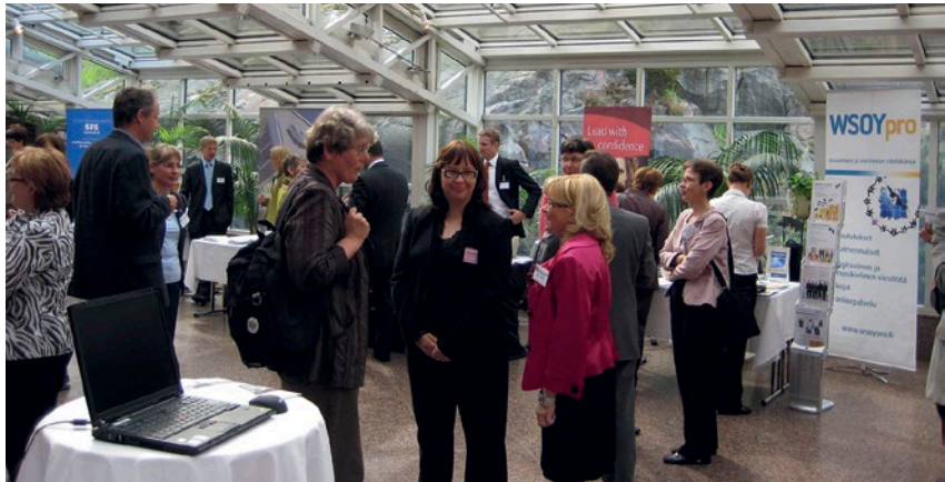
Tietopäivät 2008 näyttelytilaa, paikalla parikymmentä näytteilleasettajaa.

Tietävä organisaatio -palkinto annetaan Nokia Oyj:lle tietoasiantuntijuutta ja tietoa merkittävästi hyödyntävälle organisaatiolle. Tunnustuksen